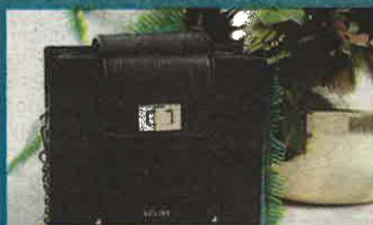
VOLINE : Maroquinerie de luxe en Beauce