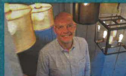
LUM'ART : Illumine le monde depuis Le Perche