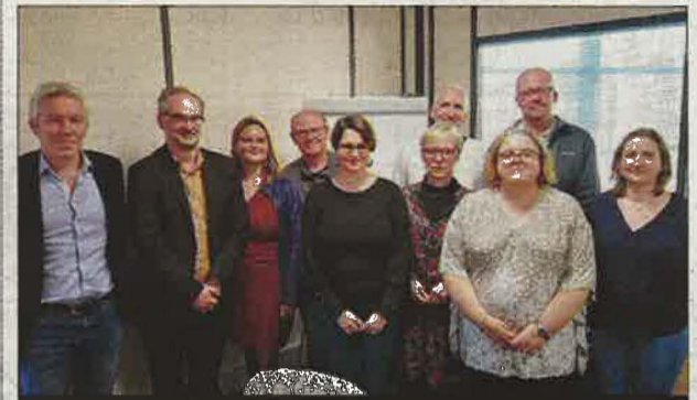
ASSEMBLÉE. Les adhérents du GEIQ Industrie d'Eure-et-Loir.

Le Geiq (Groupement d'Employeurs pour l'insertion et la Qualification) industrie d'Eure-et-Loir est une association pilotée et gérée par les entreprises du département autour de l'UIMM28. Il s'est réuni, mercredi, pour son assemblée générale, à Vernouillet.