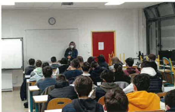
Intervention de l'entreprise Monin au collège Arsène Meunier

Cette initiative était née du constat partagé par les entreprises et les établissements scolaires que de nombreux jeunes ne maîtrisaient pas les éléments de savoir-être élémentaires pour la vie professionnelle (stage, apprentissage voire premier emploi).