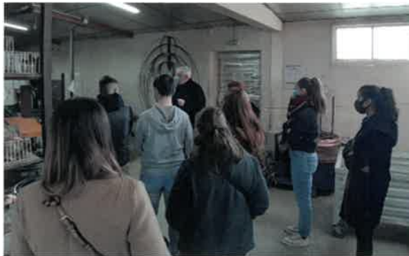
Visites des ETS CARRE et de REDEX

Cette année, ce sont les entreprises Ets CARRE à OUARVILLE, LORILLARD à CHARTRES et REDEX à SENONCHES qui nous ont accueillies.